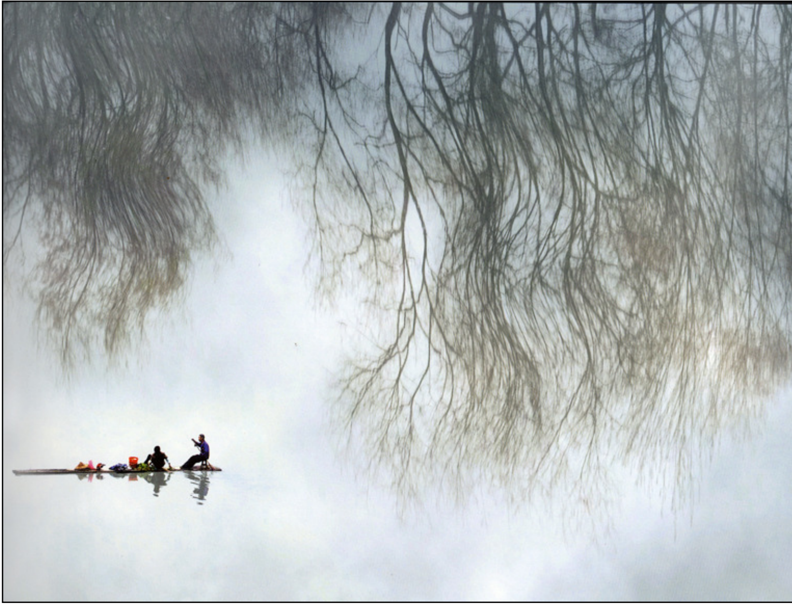
“Lake in Spring”