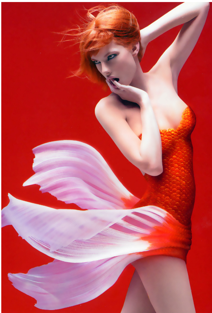
”Galleries de l'inno II” Christophe Gilbert

Cùng chủ đề nhưng Christophe Gilbert của Bỉ cho chúng ta một ảnh hấp dẫn khác là ảnh người cá được đặt tên là “ Galleries de l'inno II ”. Đan Mạch có nhiều chuyện cổ về người cá hay mỹ nhân ngư, gọi là siren. Thủy thủ hay bị những người cá này quyến rũ để vào chỗ chết. Waltz Disney có một phim hoạt họa rất hay thuộc loại này là The Little Mermaid, cô người cá si tình chàng trai người thật. Trong ảnh Galleries de l'inno II bên cạnh, ta phải công nhận sự phối hợp thật tuyệt giữa thật và giả được chuyển qua nghệ thuật nhiếp ảnh theo chủ đề màu đỏ. Bối cảnh đỏ làm nền cho áo cô gái màu đỏ sáng hơn nên không bị chìm vào nhau. Cá ở đây không phải là cá biển như mermaid mà là cá ao hồ, loại cá vàng, có đuôi trắng và lớn tỏa rộng ra, có phần duyên dáng và đẹp hơn