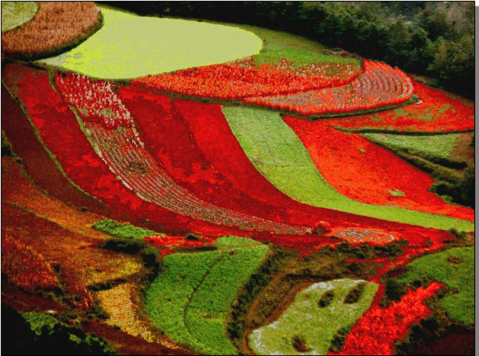
Ruộng Tầng II

Ruộng tầng trùng điệp đến tận chân trời. Nó có nhiều hình dáng khác nhau mà có lẽ vì đất núi cấu tạo thành hình thể ấy hơn là do người chia đất thành hình. Nhưng cũng có thể người vạch ra lần ranh để trồng các loại hoa màu khác nhau. Với khía cạnh người chụp ảnh, tôi chọn những đường nét nào hấp dẫn theo ý thích của riêng tôi để thu hình vào ống kính.