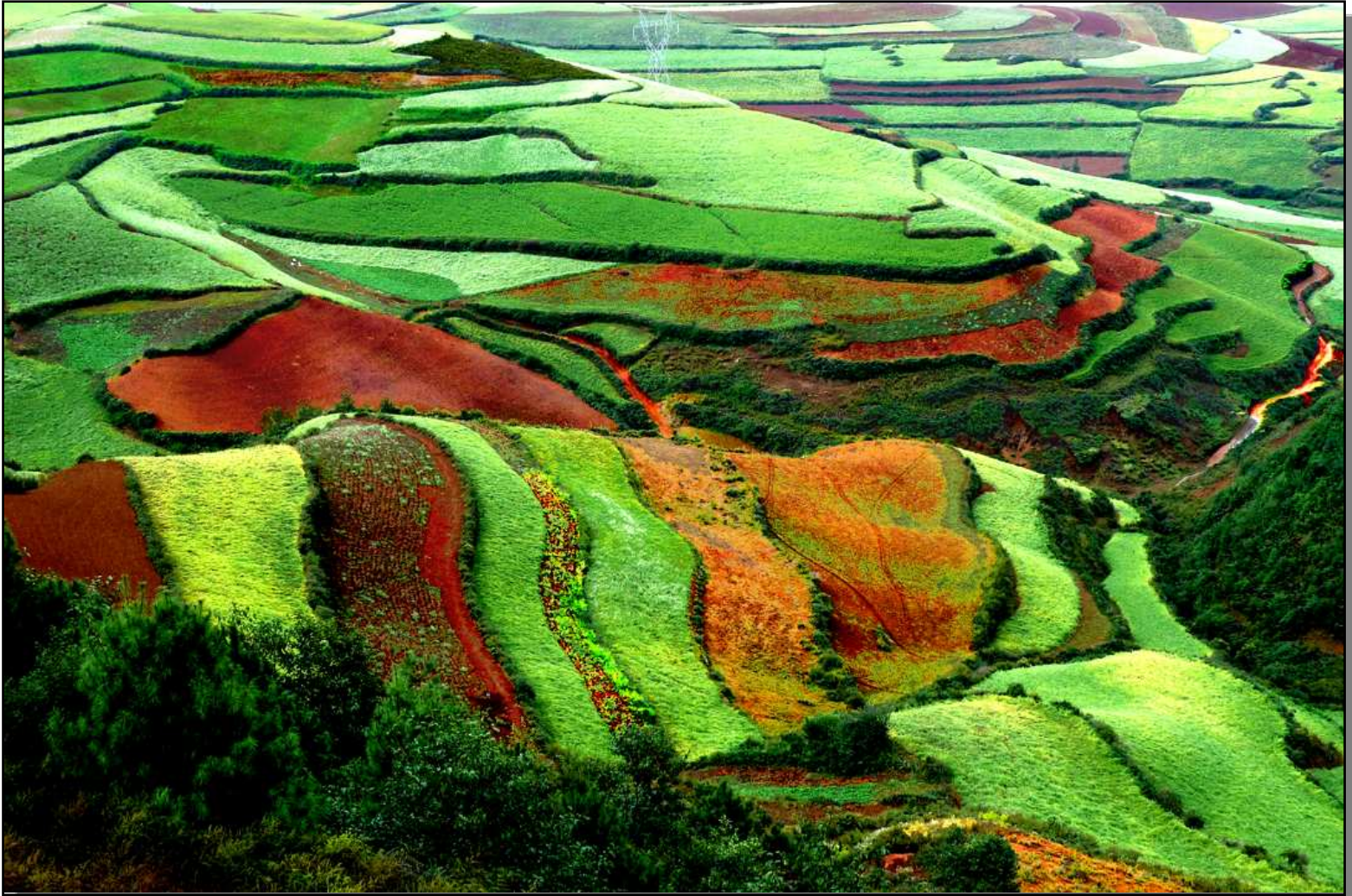
Đường Nét I