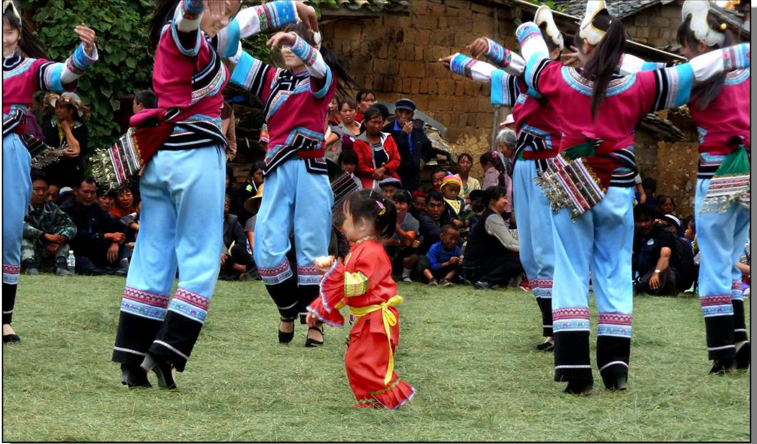
Điệu Vũ Dân Tộc