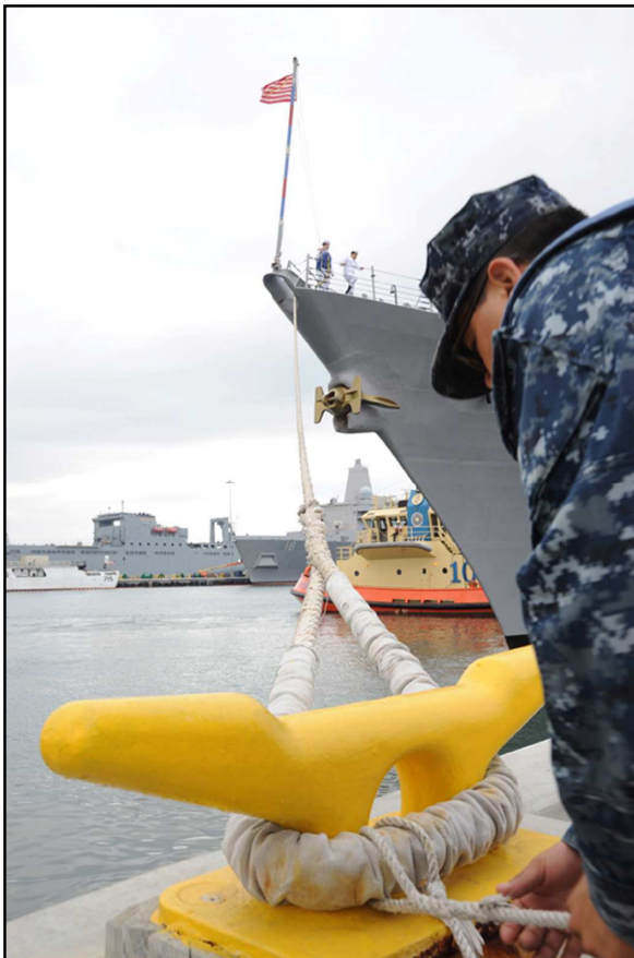
Hình 8. Tháo dây

Ba con đi xa một thời gian, rồi ba sẽ về với mẹ con mình.