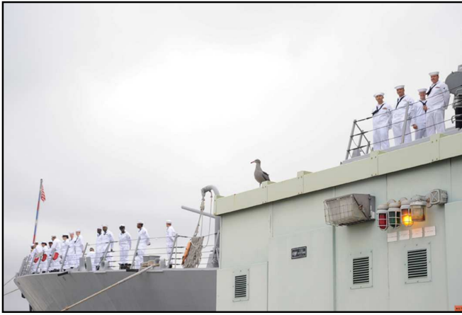
Hình 5. Nhìn nhau lần cuối?

Hình 5. Nhìn nhau lần cuối. Giờ ra khơi đã đến. Thủy thủ sắp hàng dài đứng trên bong tàu nhìn xuống người thân bên dưới. Phải còn khá lâu mới lại được gặp nhau. Hãy chúc bình an cho nhau. Lá cờ cũng buồn, không tung bay nữa. Một con hải âu lạc lõng thắp từng thủy thủ ra khơi.