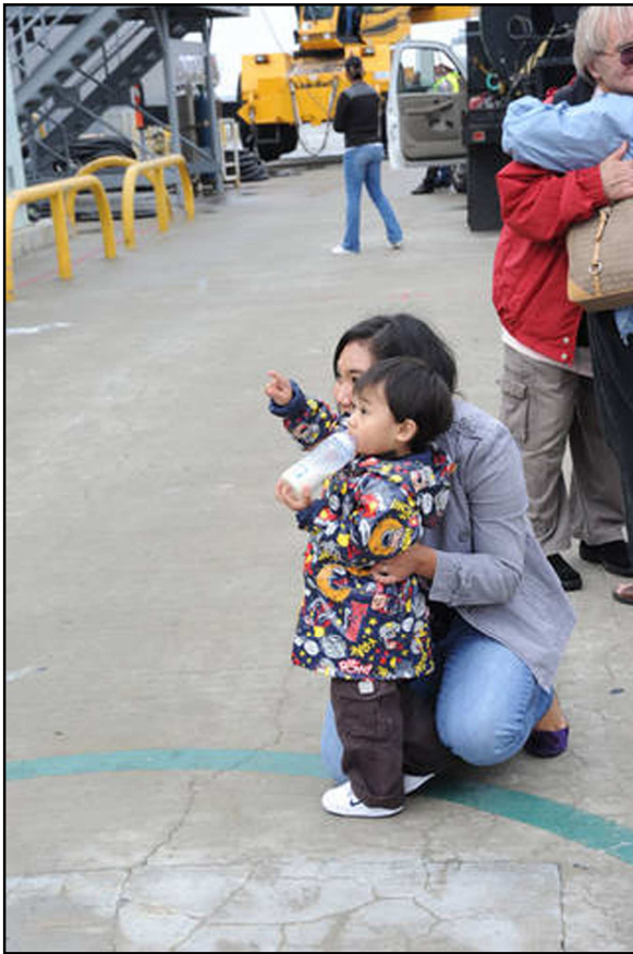
Hình 7. Ba con kia kìa

Hai mái tóc đen khác cũng đến tiễn đưa người thân. Mẹ ơi, con thấy ba con kia kìa. Ba làm gì trên đó hở mẹ?