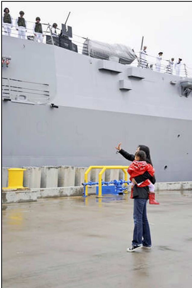
Hình 6. Vẫy tay chào

Hình 5. Nhìn nhau lần cuối. Giờ ra khơi đã đến. Thủy thủ sắp hàng dài đứng trên bong tàu nhìn xuống người thân bên dưới. Phải còn khá lâu mới lại được gặp nhau. Hãy chúc bình an cho nhau. Lá cờ cũng buồn, không tung bay nữa. Một con hải âu lạc lõng thắp từng thủy thủ ra khơi.