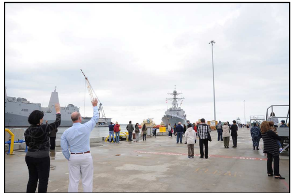
Hình 11. “So Long”

Tàu từ từ rời bến trong khi người tiễn đưa cố đi theo để còn được cảm giác gần tàu hơn.