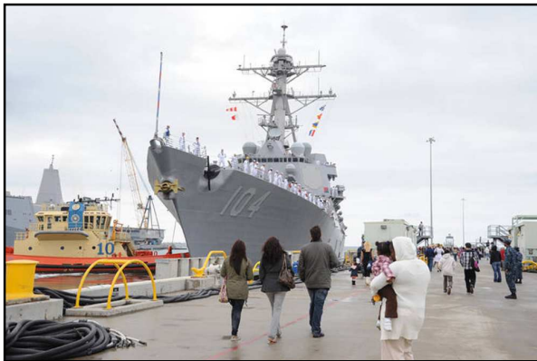
Hình 10. Tàu lìa bến

Dây đã được tháo gỡ hoàn toàn và ném theo tàu. Tàu được ủi lần ra ngoài biển khơi.