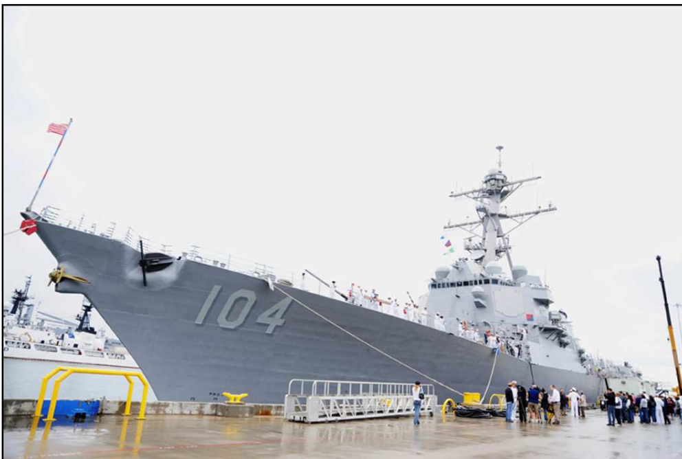
Hình 1. Khu trục hạm USS Sterett DDG 104

Tôi nhớ mấy năm trước, trong cuộc chiến I Rắc, có một ảnh phóng sự bị phanh phui thành lớn chuyện. Tác giả chụp cảnh cháy khói bốc cao. Để tăng thêm phần “hấp dẫn”, tác giả đã “clone” khói đen cho thêm vào trụ khói chính để thấy khói đen cuộn cuộn dữ dội hơn. Chỉ có một chút đó thôi, ảnh ấy không còn được kể là ảnh phóng sự.