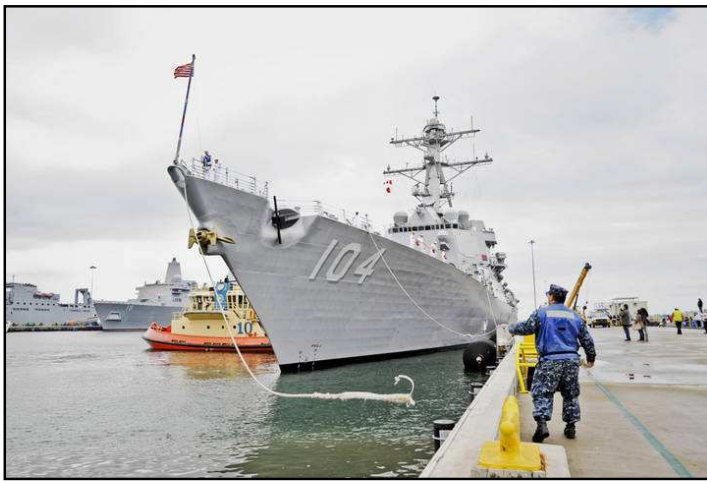
Hình 9. Rời bến

Dây đã được tháo gỡ hoàn toàn và ném theo tàu. Tàu được ủi lần ra ngoài biển khơi.