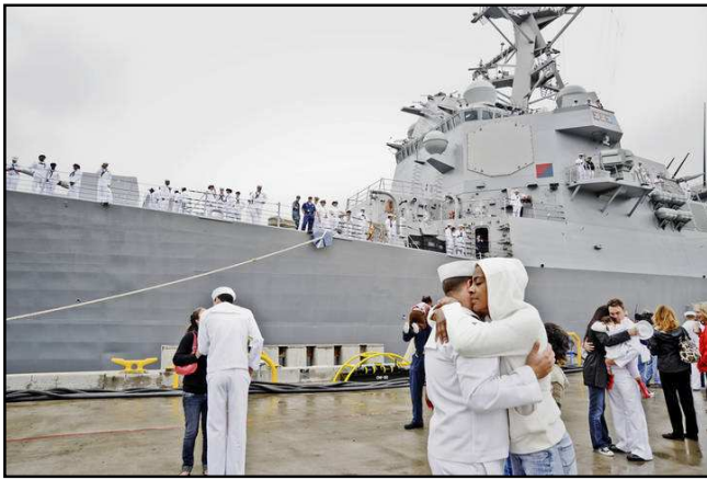
Hình 2. Bịn rịn lúc chia tay

Hình 2. Bịn rịn lúc chia tay. Ta thấy những cặp tình nhân hoặc vợ chồng ôm nhau trong quyến luyến trước khi chàng trai lên đường ra khơi. Trên bong tàu có nhiều thủy thủ đứng nhìn xuống. Có thể đây là những người từ phương xa, không tiện cho gia đình đến để nhìn nhau giây phút cuối trước khi tàu lìa bến.