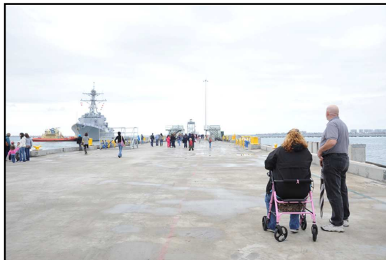
Hình 12. Đôi mắt trông theo

Những cái vẫy tay chào lần cuối, những câu kính nguyện được đọc thầm trong lòng đầy lưu luyến. Tình cảm giữa kẻ ở người đi không bút mực nào tả hết.