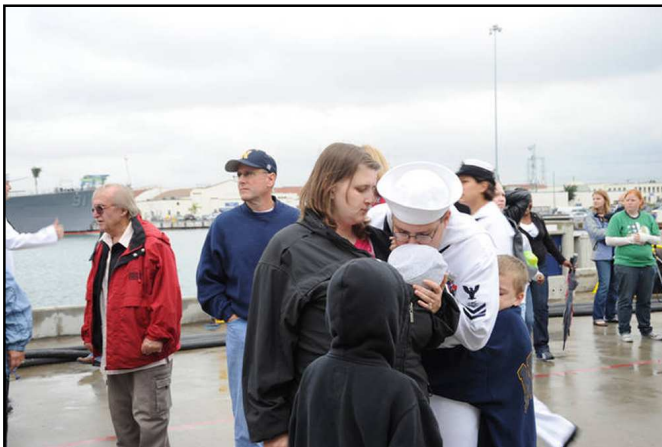
Hình 4. Hôn con

Hình 3. Anh sẽ về với em? Nhìn chặp mắt và mũi cô gái đỏ hoe ta biết cô đang khóc. Anh có về với em? Ai dám hứa chắc rằng sẽ trở về nguyên vẹn trong khi lên đường vào chốn có thể sẽ có chiến tranh khốc liệt của thời đại tân tiến này.