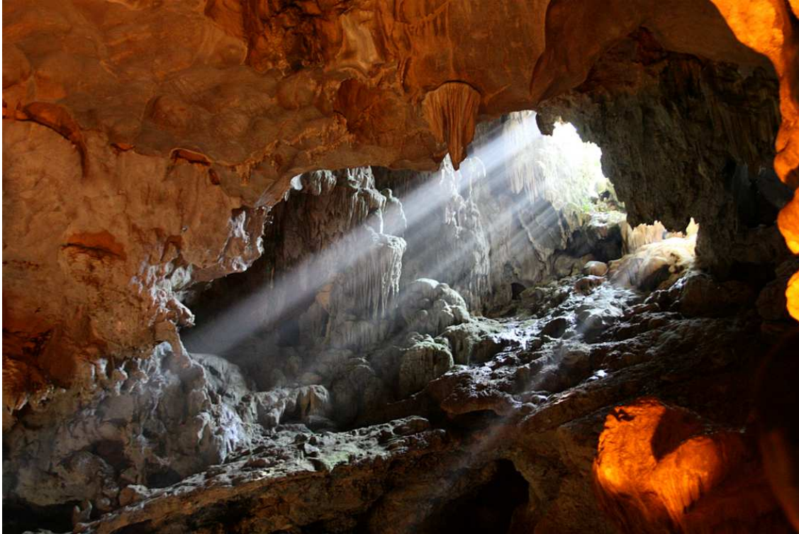
“Ánh sáng cuối đường hầm”