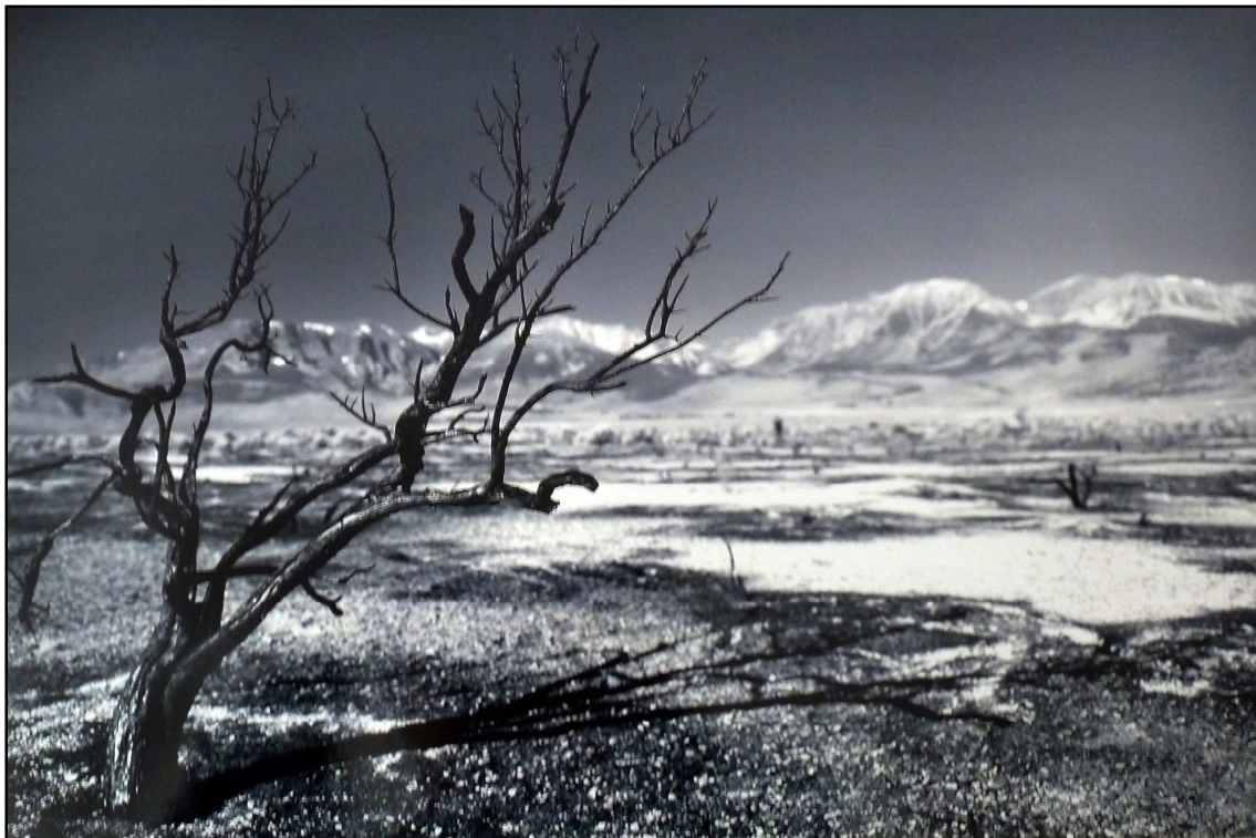
“Cảnh Vật Còn Lại”

Tôi tin ảnh nguyên thủy của Trần Khánh Băng là ảnh màu, anh đã chuyển qua thành đen trắng. Trong dạng đơn sắc này ảnh mạnh và diễn tả nhiều hơn ảnh màu. Một thành quả đáng khen.