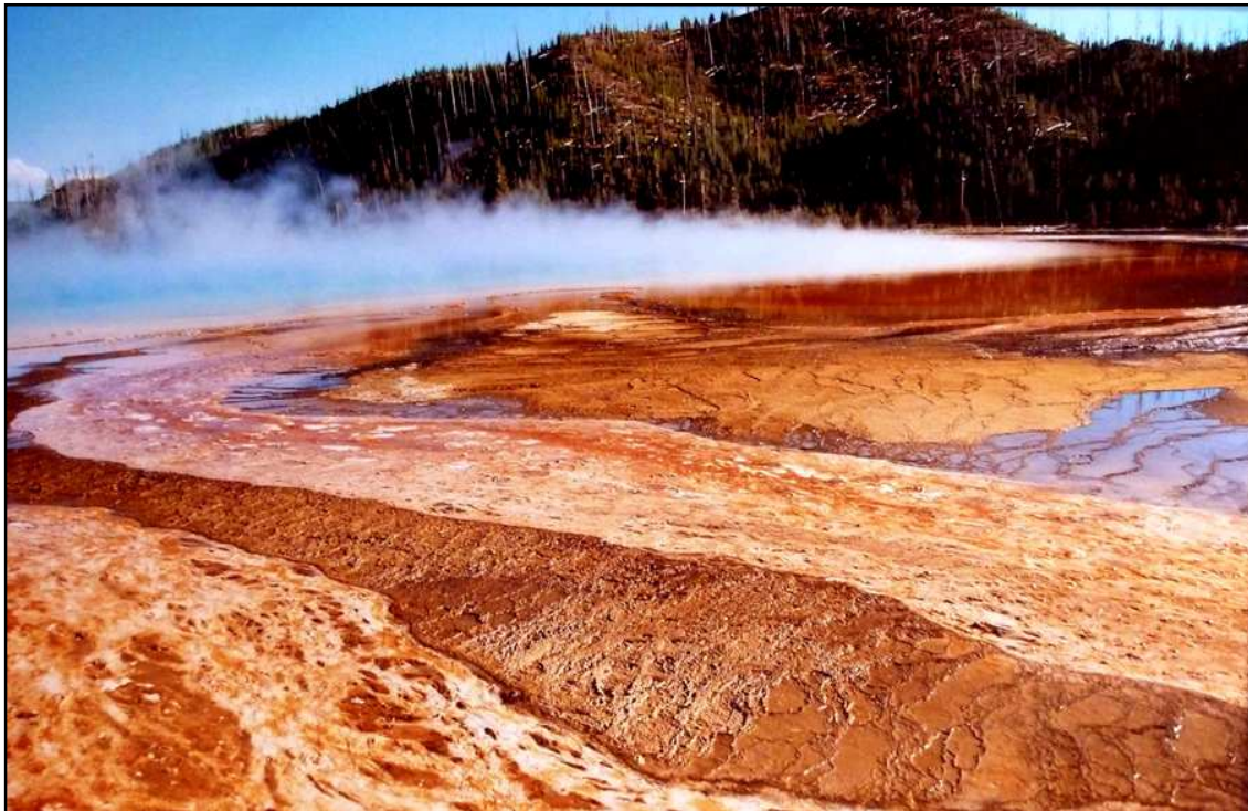
“A Giant Hot Pizza”