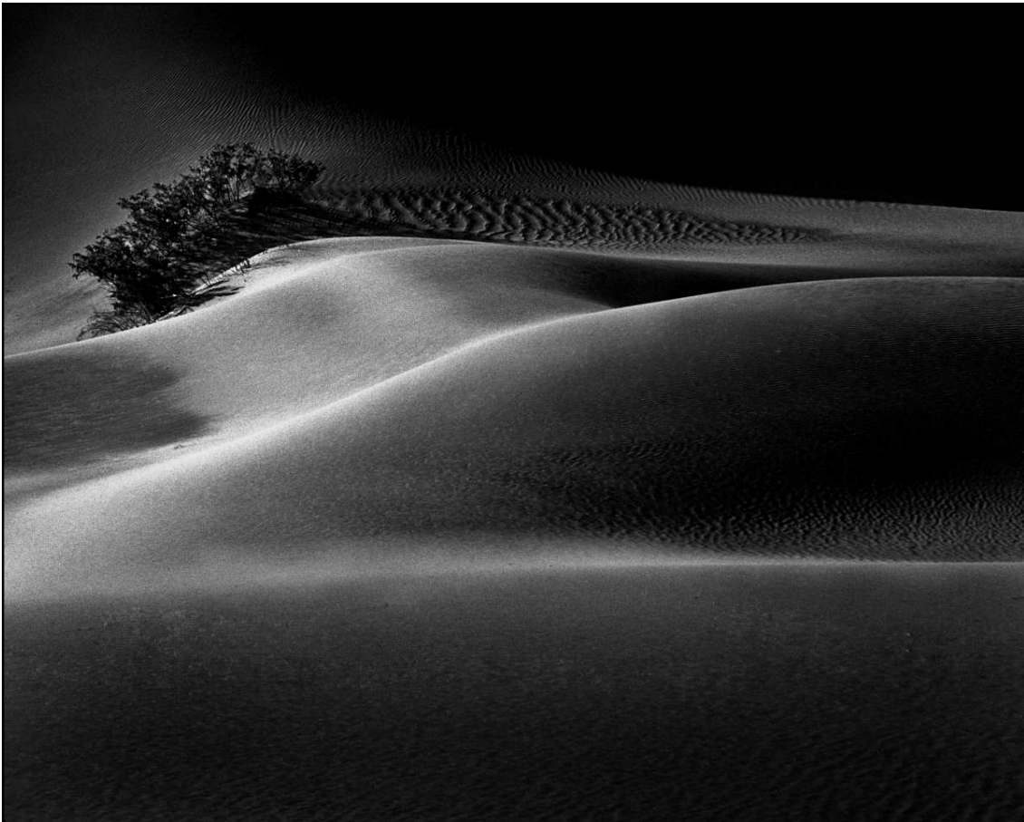
“Spirit of the Sands”